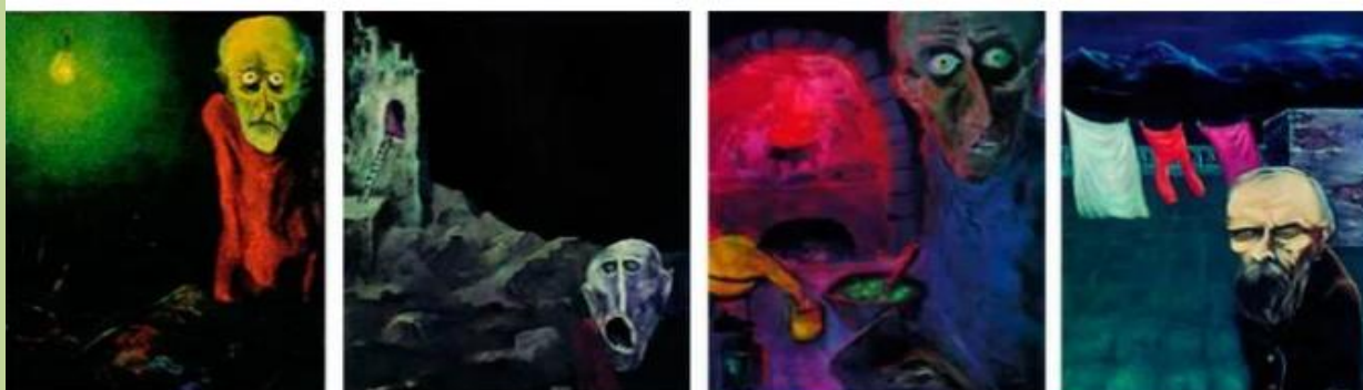
Obras pictóricas de Ernesto Sábato. De izquierda a derecha: Autorretrato ; ¿Por qué gritará? ; Alquimista III ; Dostoievski .

https://batalladepapel.blogspot.com/2011/05/la-memoria-de-ernesto-sabato.html#.YqtFPFzMK1s , recuperado el 16/06/2022