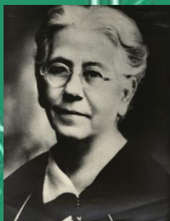
Rosario Vera Peñaloza