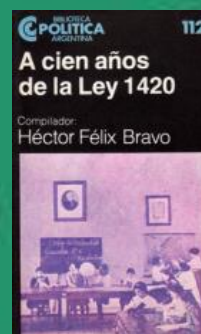
H- 2/ 7-168 (*)

(*) MATERIAL BIBLIOGRÁFICO PARA SU CONSULTA / PRÉSTAMO SOLICITAR POR EL CÓDIGO INDICADO DEBAJO DE CADA IMAGEN (Registro fotográfico del Equipo de Bibliotecarios)