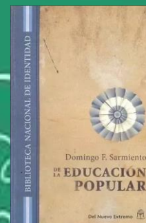
H- 6/ 6- 45 (*)